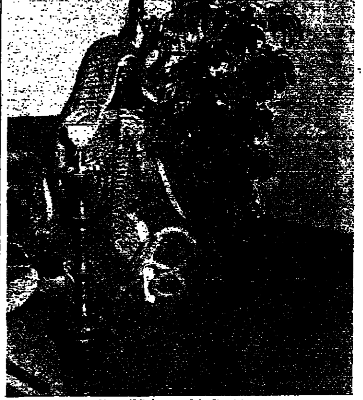
النرجيلة رفيق حميد في الخليج

المقامة البحرية (أب) من على محمود: استرخاء، يشطفون الدخان ويغفون ويصعدون ويصعدون. وعن في بيوتات انقادت، تجلس في رشاقة متكات على ضلع وقد انكمس في التدخين. انها النرجيلة، وما ادراك ما النرجيلة. ناز على القومة، يملأ عند القاعدة، وراحة واستجماع عند طيرين وكثيرات. انها جزء من معالم المناخ اللطيف الذي يتصف به المزارع من لياي الف ليلة واحدة - حيث كركرة المياض من السحبات والارواح في رقصات عيسات سلفا وتلحظ مع سحبات الدخان التي تسفل علة في الهواء كحجر الطائر والارواح المتراصة التي لا تترك ان تتولى الى اهل وتضلل وتزول. وعندما تنزوي ينشد المدخن المزيد فتعود العلفا والارواح في رقصات عيسات سلفا لطاه البحرية طوقس الموت. سحبا للشيطان، ايمن ان يكمن الموت في قوام النرجيلة الرشيق كقرون بقوا مشدودين، ومنهم من سئل ما قال يعرف اربعة اطباء متوحا. في شياهم، رغم انهم لم يكونوا من المدخنين، وكانوا في حيلهم يحضون الناس على ترك الدخان.